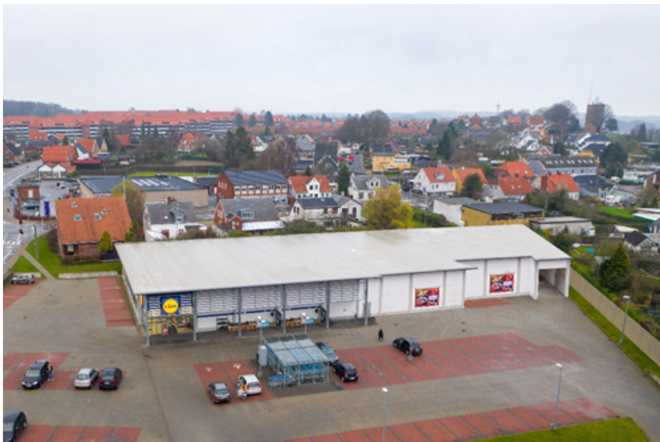
Figur 2. Lokalplanområdet set fra sydvest. Illustrationen viser, hvordan butikken kan udvides mod sydøst. Facaden brydes med facadedetaljer pr. min. 7 m. jævnfør § 7.2.

Den eksisterende Lidl butik udvides mod sydøst. I forbindelse med udvidelsen etableres en overdækket varegård. Butikken udvides med samme facadeudtryk som den eksisterende butik.