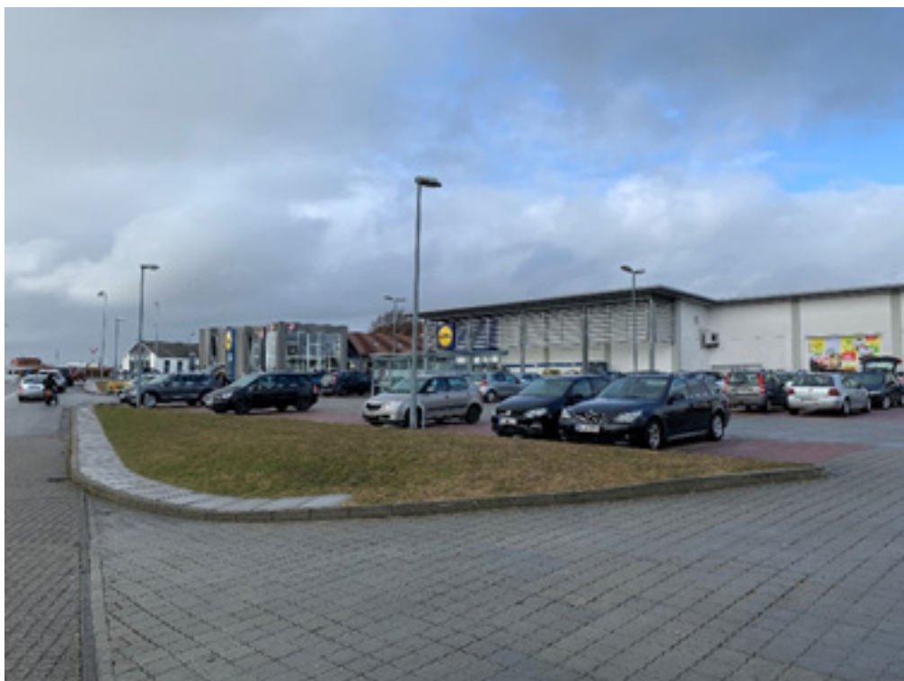
Foto 3. Den eksisterende Lidl butik set fra syd.