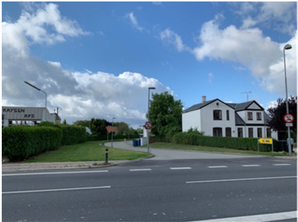
Foto 1. Areal ud mod Vestergade.

Vejadgangen til området sker primært fra Mølmarksvej via en rundkørsel, der ligeledes betjener Svendborg Storcenter nord for Mølmarksvej. Vejadgangen til dagligvarebutikken er etableret som fælles vejadgang med de udvalgswarebutikker, der ligger sydvest for dagligvarebutikken. Ved lokalplanens udarbejdelse er der tale om Ilva, Jysk, Elgiganten og Harald Nyborg.