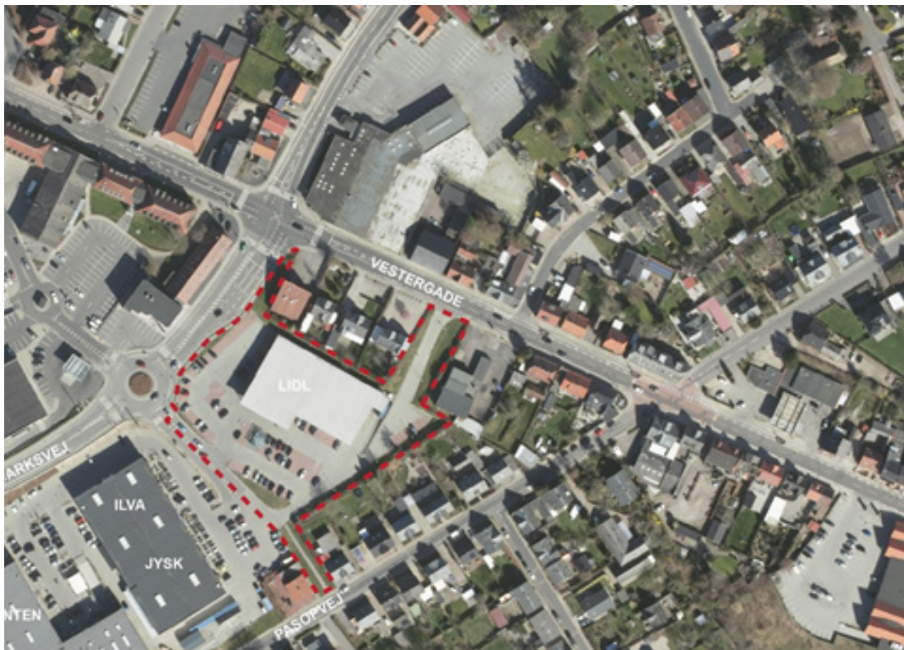
Lokalplanområdets afgrænsning er markeret med rødt.