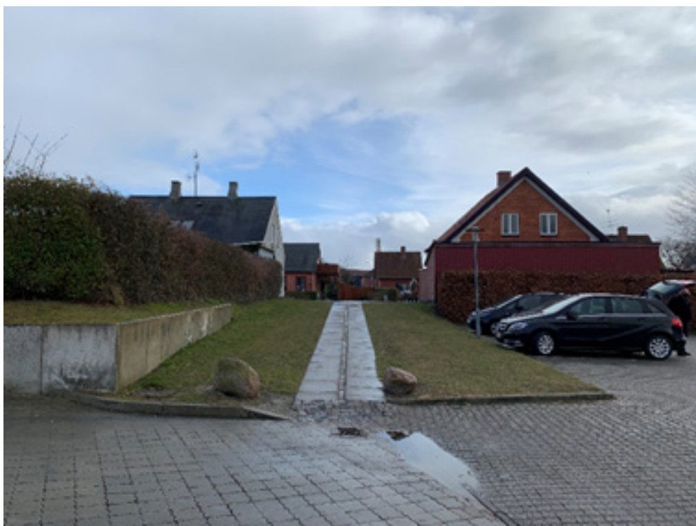
Foto 2. Eksisterende sti-forbindelse til Pasopvej.