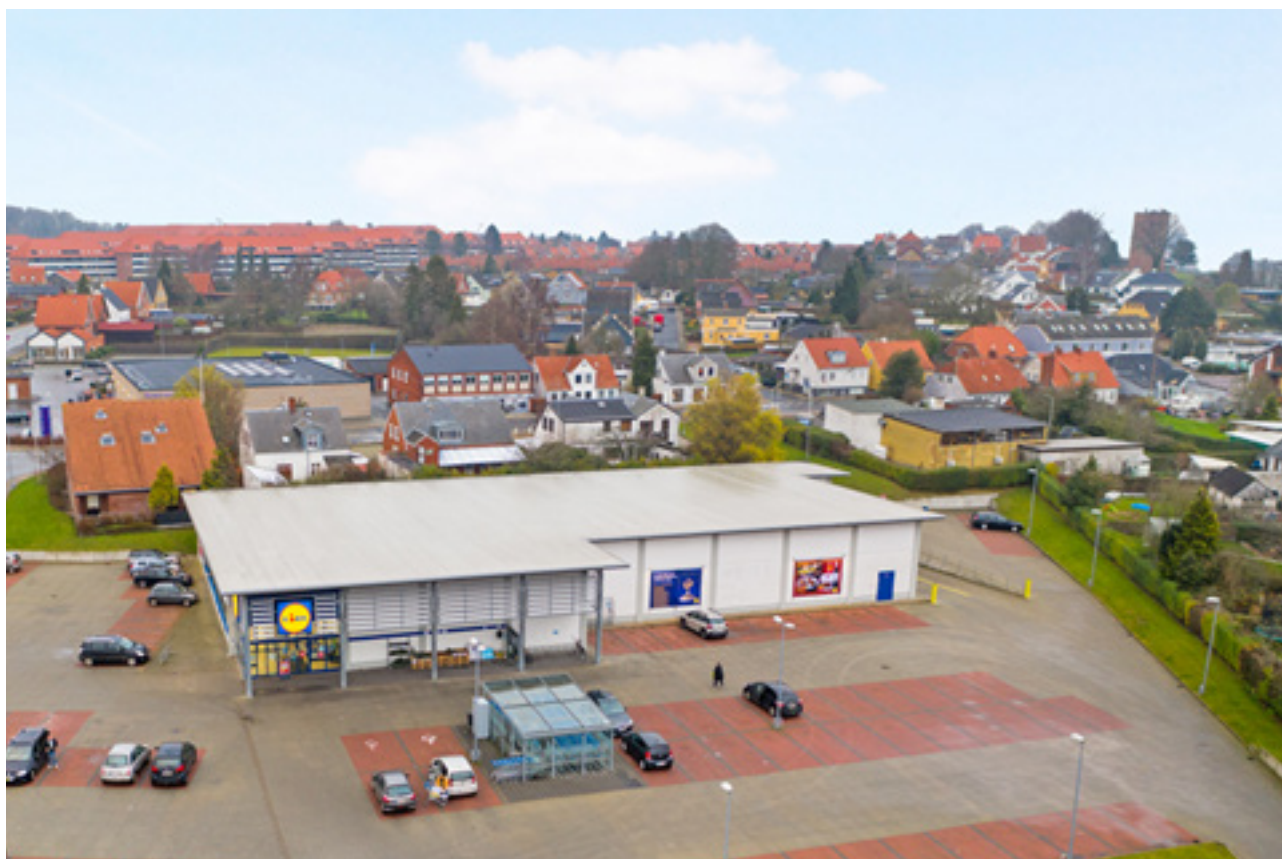
Figur 1. Lokalplanområdet set fra sydvest. Området som det fremstår ved lokalplanens udarbejdelse, inden udvidelse.